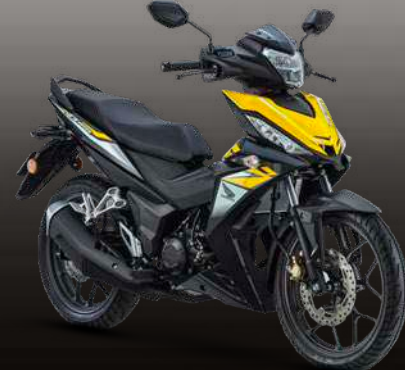
RADIATE GREY METALLIC