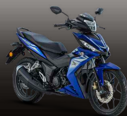
PEARL NIGHTFALL BLUE